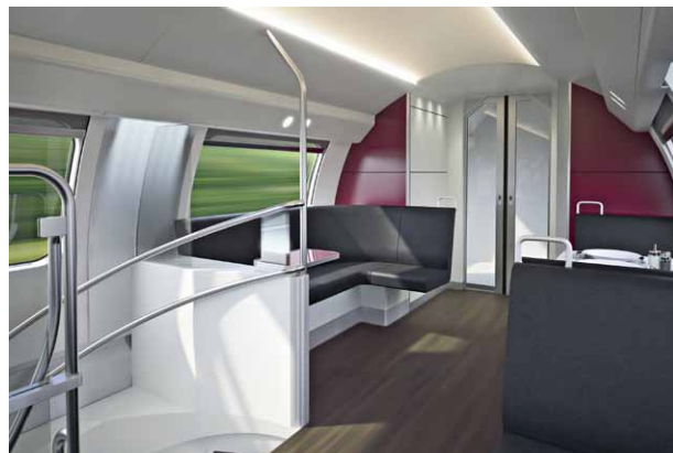
Lounge-Bereich im Restaurant des TWINDEXX Express